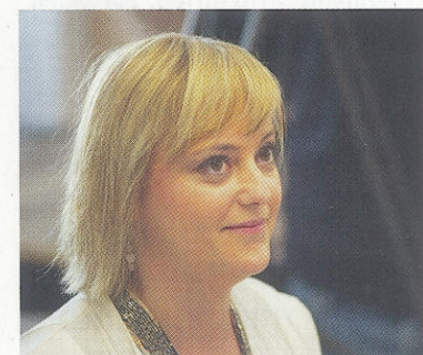
Kunden aus verschiedenen Ländern erwarten unterschiedliche Ansprechpartner.